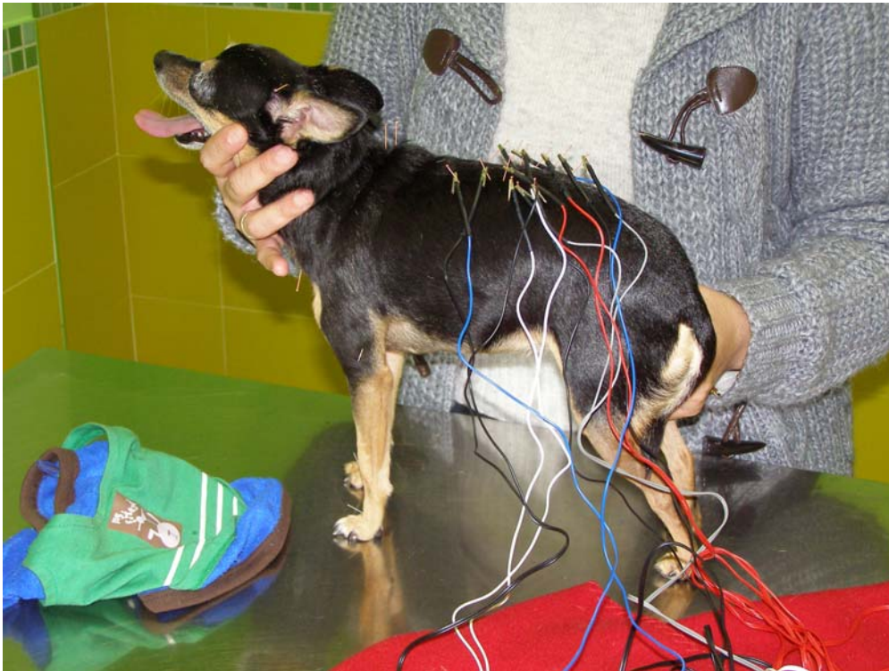
Perra con problemas musculares que producían mucho dolor siendo tratada mediante electroacupuntura.

La primera vez que nos hablan de medicina tradicional china solemos ser incrédulos y no creer en esos “nuevos tratamientos” que nos ofrecen. Pero la realidad es bien distinta, este tipo de medicina ha sido empleada y estudiada, tanto en personas como animales, desde hace miles de años siendo muy rigurosos en su estudio.