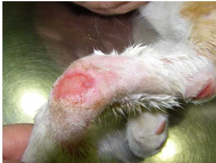
Mismas heridas dos días después.

La dieta y la fitoterapia nos resulta mucho más fácil de entender ya que son tratamientos similares a los de la medicina occidental. ¿Quién no ha oído hablar sobre las ventajas de la dieta mediterránea? ¿o sobre los beneficios o efectos de determinadas plantas? La medicina tradicional china ha realizado muchos estudios sobre el uso de ambos tratamientos siendo muy protocolizados, también ha cambiado mucho en los últimos años eliminándose el uso de productos supersticiosos que acompañaban estos tratamientos (huesos de tigre y similar); en cambio la medicina occidental esta estudiando estos tratamientos para encontrar la explicación de su efectividad desde el punto de vista científico y poder utilizarlos también en forma de presentaciones occidentales (comprimidos, capsulas, inyectables, etc).