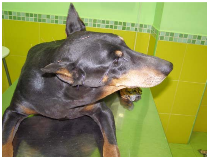
Perra con un síndrome vestibular siendo tratada mediante acupuntura seca y medicina tradicional china.

La mayoría de los acupuntos son puntos motores: gran número de estudios muestran que su estimulación induce la liberación de beta-endorfinas, serotonina y otros neurotransmisores, lo que demuestra la acción de la acupuntura sobre el dolor, mejora en la tensión sanguínea, etc.