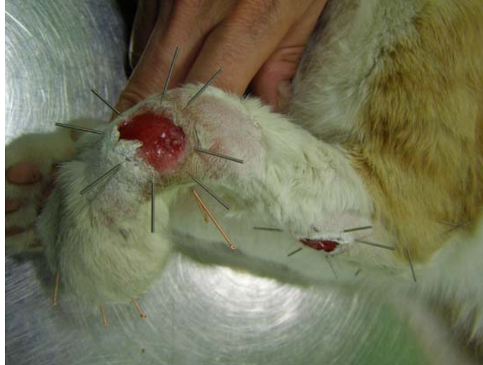
Gato siendo tratado de unas heridas mediante acupuntura seca, como apoyo de la veterinaria occidental.