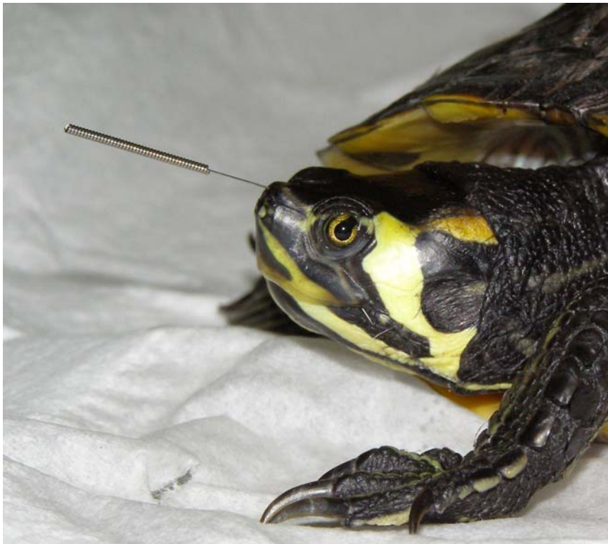
Tortuga con neumonía siendo tratada con acupuntura seca como apoyo a la veterinaria occidental.

Todas las especies animales pueden ser tratadas con medicina tradicional china, aunque según que especies y el carácter individual del animal será mejor utilizar una u otra técnica. Por ejemplo en un gato que se estrese mucho en la consulta puede ser contraproducente el acudir a ella para la consulta de acupuntura y será mejor tratarlo con hierbas.