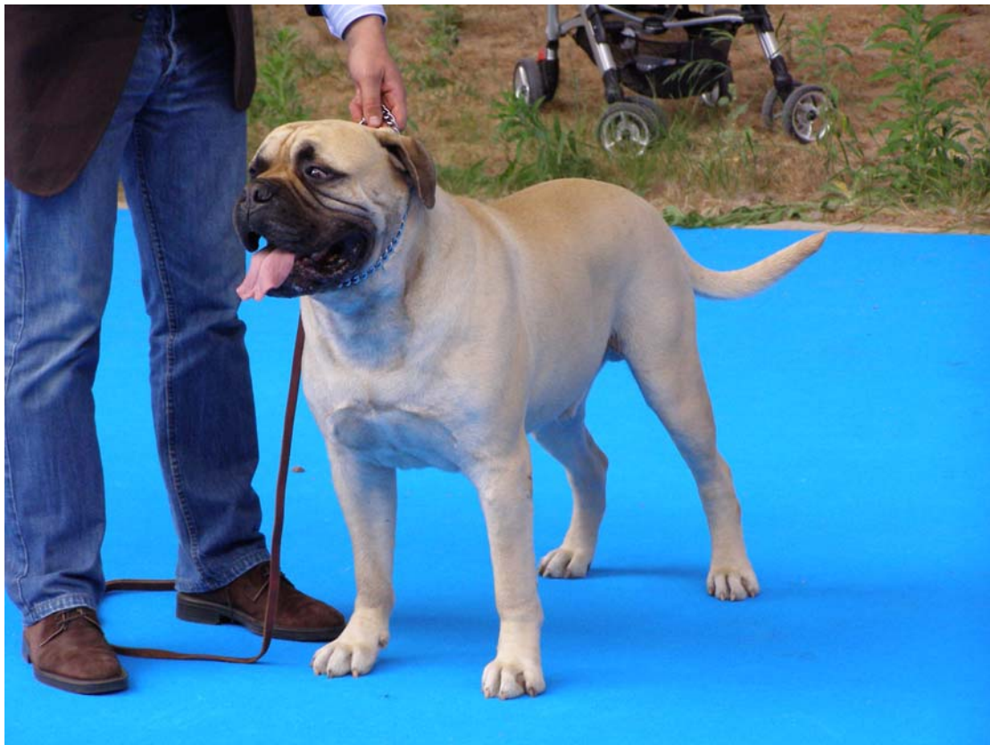
Los bullmastiff son un buen ejemplo de perros que no están en la lista de razas potencialmente peligrosas pero que cumplen la totalidad de las características de un perro potencialmente peligroso

3 En todo caso, serán considerados perros potencialmente peligrosos aquellos animales de la especie canina que manifiesten un carácter marcadamente agresivo o que hayan protagonizado agresiones a personas o a otros animales. La potencial peligrosidad habrá de ser apreciada por la autoridad competente atendiendo a criterios objetivos, bien de oficio o bien tras haber sido objeto de una notificación o una denuncia, previo informe de un veterinario, oficial o colegiado, designado o habilitado por la autoridad competente autonómica o municipal.